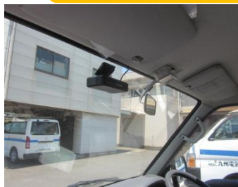
〔社用車にドライブレコーダー〕