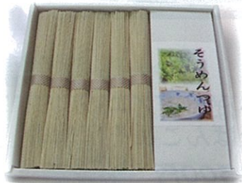
B-8 1,580円 そばそうめん&つゆ