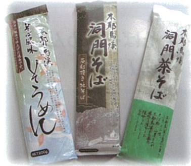
B-1 1袋320円 洞門そば・茶そば・そばそうめん