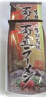
B-5 1,050円 蕎麦ラーメン2袋箱入