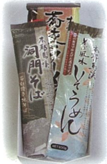
B-6 1,200円 蕎麦ラーメン&そば2袋