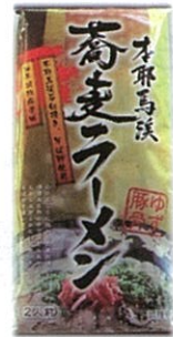
B-2 480円 蕎麦ラーメン