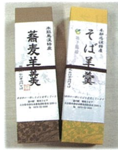
B-3 1本880円 蕎麦羊羹