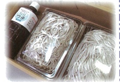
ざるそば用つゆ付き