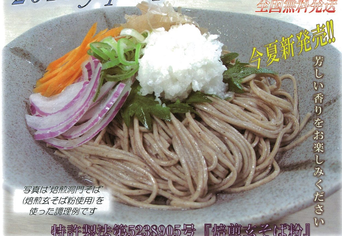
写真は'焙煎洞門そば' (焙煎玄そば粉使用)を 使った調理例です