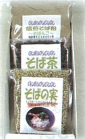
B-7 1,300円 そばんこ・そば茶・そばの実