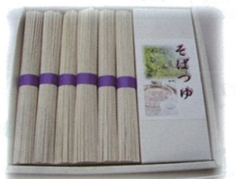
B-9 1,580円 洞門そば&つゆ