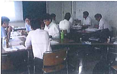
昨年度のワークショップ風景

「大分県BCP策定支援協定プロジェクト」では、「BCPワークショップ」を開催します。参加企業の皆様は、まず1日の講座を受講いただきます。