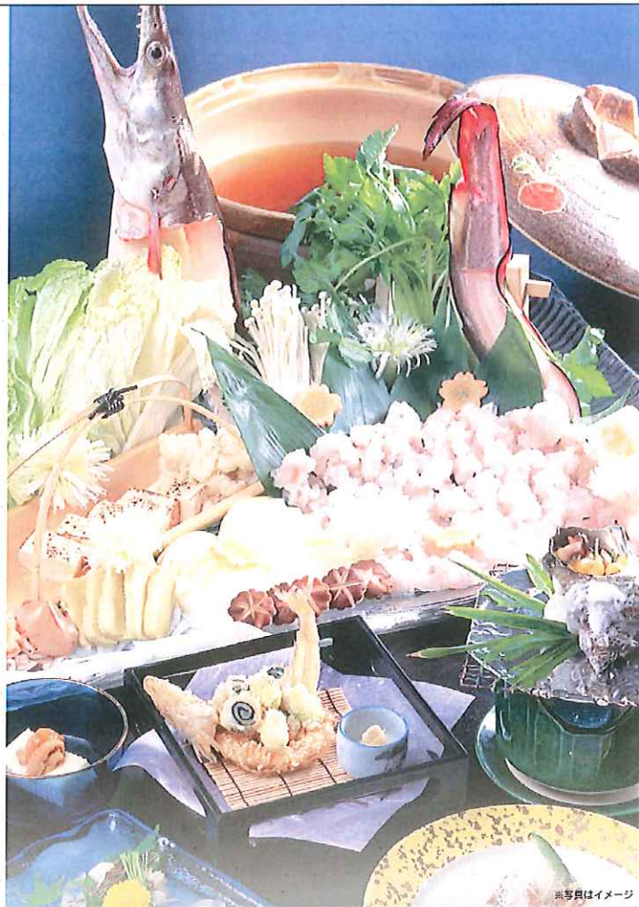
写真員はイメージ