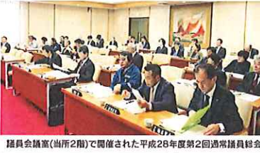
議員会議室(当所2階)で開催された平成28年度第2回通常議員総会