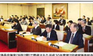
議員会議室(当所2階)で開催された平成30年度第2回通常議員総会