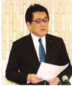
「今後も会議所活動にご支援を願いたい」と仲会頭

中津商工会議所第2回通常議員総会を3月22日、当所議員会議室で開催し、2019年度事業計画、収支予算案について審議した。 総会では、仲会頭より、「去る3月20日に日本商工会議所の総会があり、安倍総理をはじめ多くの総来賓や、全国から390の商工会議所が出席していた。三村会頭から、3期目の表明があり、その中で「我が国経済