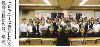
卒業生は、令和2年度近藤会長杯より卒業証書と記念品を授けられた。

中津の地域づくり・まちづくりを目的として活動する団体(個人)に対し助成金の交付を行います。 対象となる団体(個人)は、中津市内において行われる事業で当該協会の目的に資するもの。