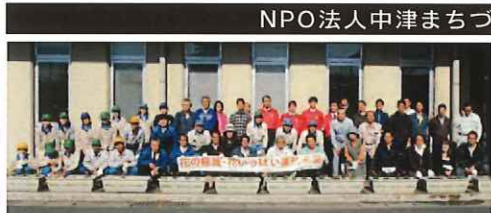
当日は委員をはじめ、当会の理事や地域住民・事業所職員ら合わせて59名が参加しました

NPO法人中津まちづくり協議会 津まちづくり協議会(仲浩)は、11月13日、環境整備推進委員会(新居)と連携して、花の苗を植えたプランターを設置しました。花の苗は、協議会が育て、花の苗を植えたプランターを設置しました。花の苗は、協議会が育て、花の苗を植えたプランターを設置しました。