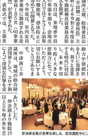
「第60回永年勤続優良従業員表彰式」開催の様子

11月20日、ウイラールにおいて、中津商工会議所主催の「第60回永年勤続優良従業員表彰式」を開催しました。