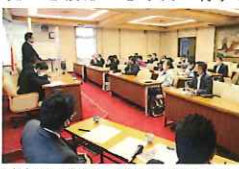
5部会正副会長会議開催の様子