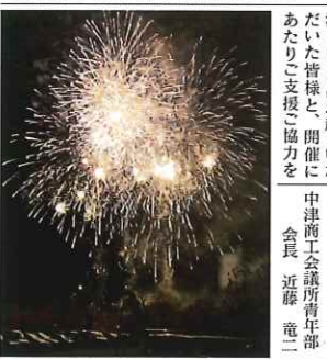
第11回Loveファンタジア中津2020の様子

12月19日、中津商工会議所青年部主催の第11回Loveファンタジア中津2020を開催しました。