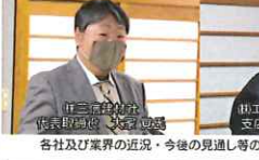
第3回重要商工業者懇談会開催の様子

中津商工会議所は12月15日、令和2年度で3回目となる、重要商工業者懇談会を開催しました。