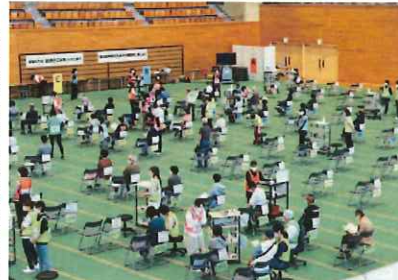
中津市では事前にも2回のシミュレーションを実施し、接種場所に隣ったままでも接種ができるように改善した

中津市では事前にも2回のシミュレーションを実施し、接種場所に隣ったままでも接種ができるように改善した 中津市では事前にも2回のシミュレーションを実施し、接種場所に隣ったままでも接種ができるように改善した 中津市では事前にも2回のシミュレーションを実施し、接種場所に隣ったままでも接種ができるように改善した