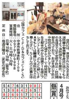
猫カフェC.F.D&カフェC.P.S 「ヘア入場チケット(1時間無料)」をプレゼント!!

猫カフェC.F.D&カフェC.P.S 「ヘア入場チケット(1時間無料)」をプレゼント!! 今週末(24日)中津市で唯一の猫カフェ「猫カフェC.F.D&カフェC.P.S」が「ヘア入場チケット(1時間無料)」をプレゼントしています。このチケットは、中津市にある猫カフェ「猫カフェC.F.D&カフェC.P.S」で利用できます。このチケットは、中津市にある猫カフェ「猫カフェC.F.D&カフェC.P.S」で利用できます。