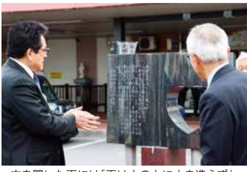
本を開いた面には「天は人の上に人を造らず」から始まる著書の冒頭の部分が内容を理解しやすいよう現代語訳で刻まれている