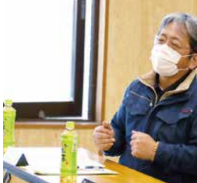
講話後、参加者から活発な意見が出された