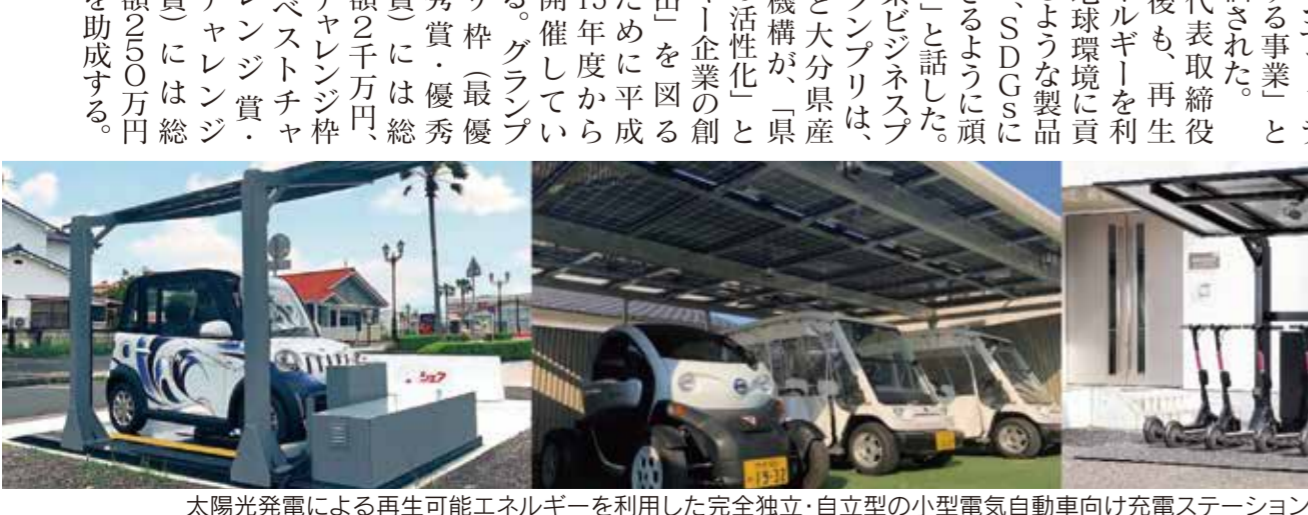
太陽光発電による再生可能エネルギーを利用した完全独立・自立型の小型電気自動車向け充電ステーションは日本初