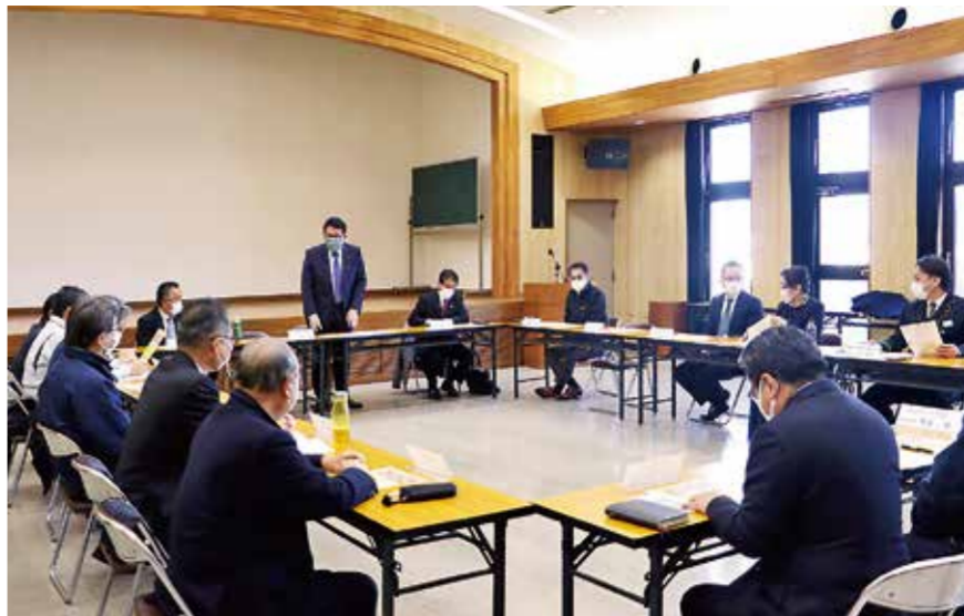
5部会とは〈商業部会〉〈工業部会〉〈観光・運輸・情報部会〉〈金融・理財部会〉〈社会・サービス部会〉で構成されている

中津商工会議所は2月24日、〈商業部会〉〈工業部会〉〈観光・運輸・情報部会〉〈金融・理財部会〉〈社会・サービス部会〉で構成される5部会正副部会長会議を開催。仲会頭が「昨年12月に発行したプレミアム商品券・食券の利用期間が5月1日に終了する。それに合わせて新たに5月2日から使用できる中津市プレミアム商品券を販売することが決定した。プレミアム率は30%となっており、1万円円の購入で、1万3千円分のお買物やお食事にご利用できる。発行総額は10億4千万円で、4月14日より販売を開始する。今回は、前回と違い、購入対象者が大分県民となることから競争率が上がるかもしれないが、是非とも購入していただき、市民で信頼、協力して中津で買えるものは中津で買うようにしてほしい。」 新型コロナウイルス感染症はもとより、ウクライナ情勢についても予測がつかず、大変困難な状況だが、みんなで力を合わせて乗り切っていきたい」とあいさつ。議事では各部会進捗状況、各業界・業況について報告し、会議は終了した。