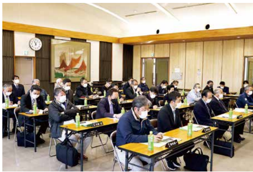
常議員23名が出席した

中津商工会議所は、第5回常議員会を2月9日、当所3階大ホールで開催した。 浩会頭は、開会に当たって常議員の皆さんに商工会議所の諸事業への協力について謝意を述べるとともに、続けて第4回常議員会(12月14日開催)以降の取組等について、次のとおり報告を行った。