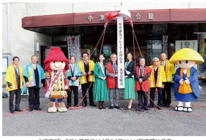
中津市プレミアム商品券は4月14日(木)より販売開始予定(写真は昨年の中津市プレミアム商品券販売セレモニー風景)

中津市は、新型コロナウイルス感染症拡大に伴い、停滞した経済活動を回復するために、昨年12月発行分のプレミアム商品券・食事券の利用期間終了に合わせて、新たに「中津市プレミアム商品券」を販売することを決定した。プレミアム率は30%。1万円分の購入で、1万3千円分のお買物、お食事にご利用でき、発行総額は10億4千万円(販売総額8億円)。令和4年4月14日(木)より販売開始予定。