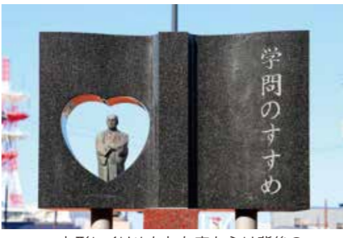
ハート形にくりぬかれた穴からは背後の福澤諭吉先生像が眺められるようになっている