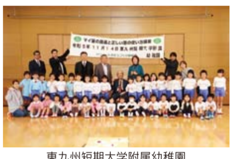
東九州短期大学附属幼稚園