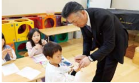
給食の際には、園児同士でお箸の持ち方を確認してから食べ始めるなど意識の変化も見られている

団体名: Jウイングジュニアバレーボールクラブ 活動内容: 部員・保護者で如水小学校周辺や不特定多数の人が使う道路周辺のゴミや空き缶を拾い、綺麗にする。