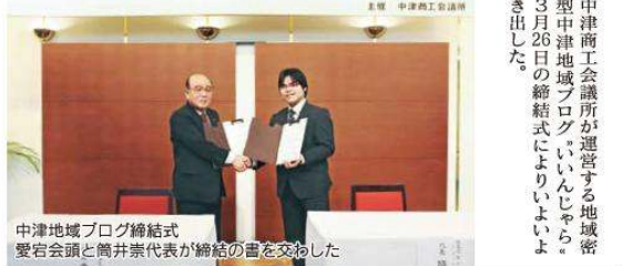
中津地域ブログ締結式 愛宕会長と筒井業代表が締結の書を交わした