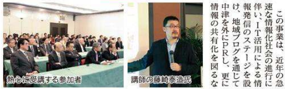
熱心に受講する参加者