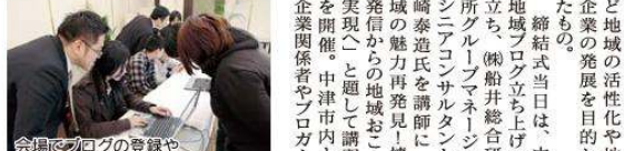
会場でのブログの登録や 書き込みを行う参加者

この事業は、近年の急速な情報化社会の進行に伴い、IT活用による情報発信のステージを設け、地域ブログを通じて中津を外にPRし、更に情報の共有化を図るなどの目的で行う。この事業は、近年の急速な情報化社会の進行に伴い、IT活用による情報発信のステージを設け、地域ブログを通じて中津を外にPRし、更に情報の共有化を図るなどの目的で行う。 この事業は、近年の急速な情報化社会の進行に伴い、IT活用による情報発信のステージを設け、地域ブログを通じて中津を外にPRし、更に情報の共有化を図るなどの目的で行う。