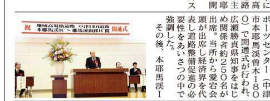
中津日田道路(本耶馬溪)開通式の様子

中津一日田間、一刻も早い全線完成を 中津港から日田市に至る延長50kmの地域高規格道路中津日田道路のうち大分県が事業主体で整備している本耶馬溪道路(5km)が開通した。 3月31日に、禅海ス