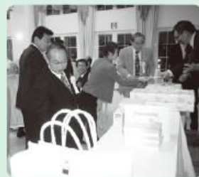
ピンゴゲームで特産品プレゼント

また、料理も地元中津市で採れた新鮮な海の幸、山の幸などを使った料理が振る舞われ、県産品や地元ならではの逸品に開かれ、出席者全員、終始和やかなムードのなか内外情勢や地域経済等の情報交換、新年の抱負などを語り合い、新年の門出を全員で祝福した。