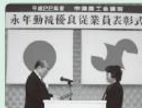
愛宕会頭より各年次代表者に表彰状と記念品が手渡された