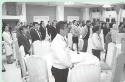
当日は受賞者67名が出席

表彰式では、主催者を代表して愛宕会頭より「社会発展の原動力となるのは皆様方の改革革新への挑戦する気概と日々の取り組みだと考えています。持ちこたえぬや、独創性を大いに発揮され、これまで培った経験や識見を活かし、中津市の未来に向けて新時代を切り開いていただきたいと思います。」と挨拶。