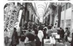
写真は12月26日(日)に開催した南部自由市場の様様